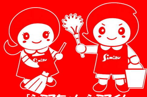
「シミスちゃん・シミスくん」